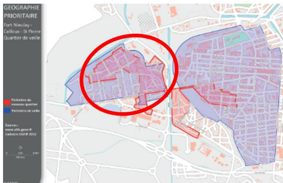
Délimitation du quartier prioritaire (QPV en rouge) et du périmètre de veille (en bleu) du Fort Nieulay-Cailloux-Saint-Pierre

L'étude fera un zoom sur le secteur Fort Nieulay/Constantine (cercle rouge).