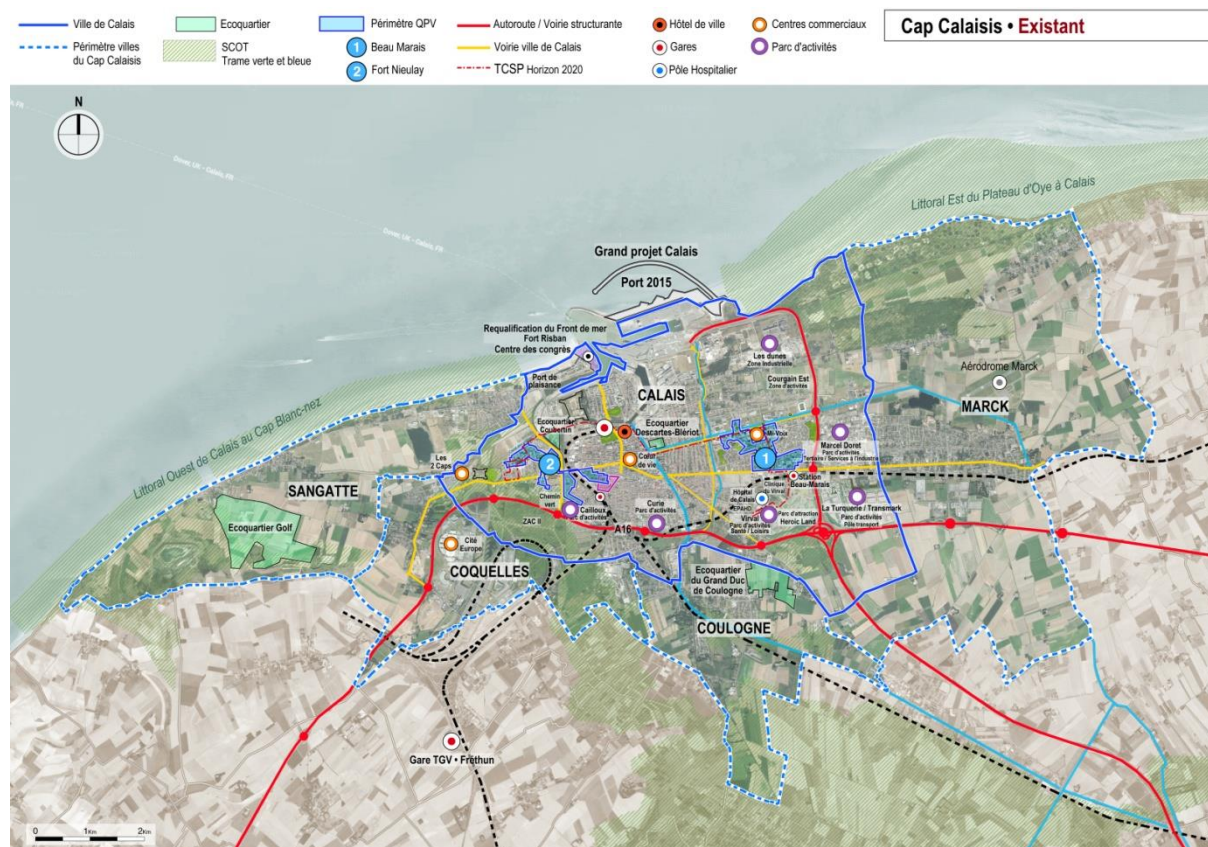
Les projets en cours au sein de l'agglomération

Le projet est porté par la commune de Sangatte et vise la construction d'un nouveau golf sur 120ha et de 270 logements dont 90 villas et 230 logements touristiques. Le projet doit aboutir à l'horizon 2022. Il est porté par une ZAC et un aménageur.