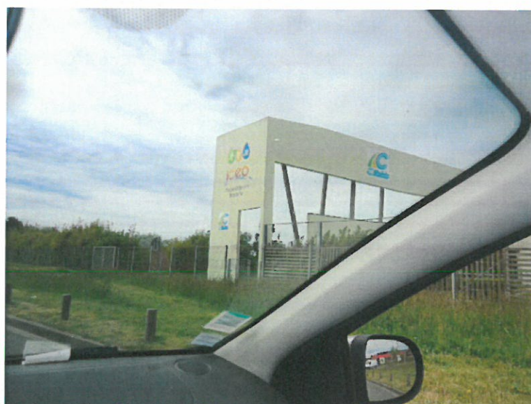
Article 1.20 : Remplacement plaque Dibond en hauteur